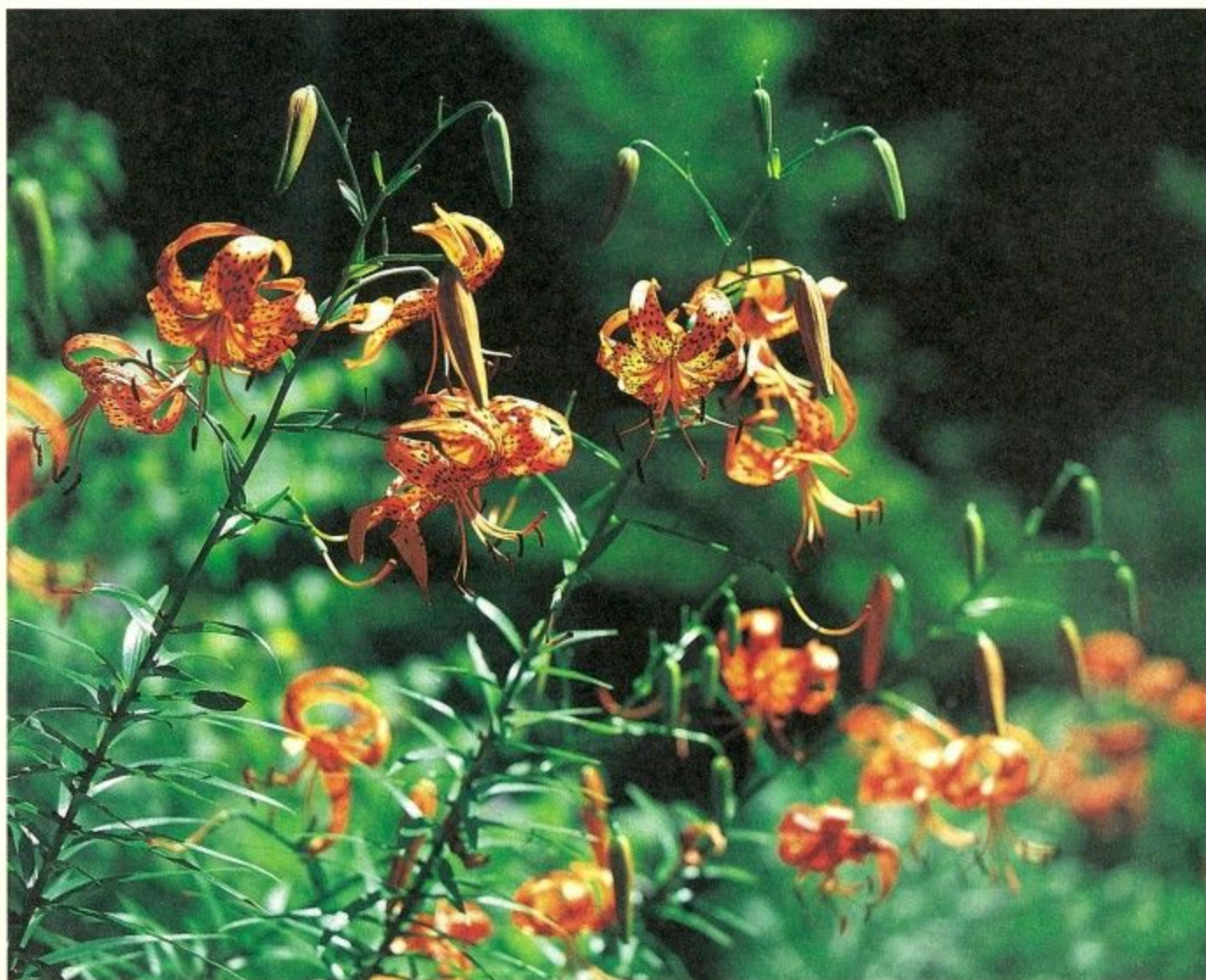
夏の野山に大輪の花を咲かせるオニユリ