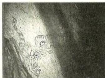
キトラ古墳壁画 白虎

古代のロマンを感じさせる高松塚古墳からキトラ古墳までの調査研究について、スライドを使い、分かりやすく学びます。