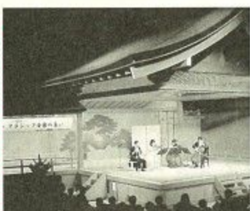
県新公会堂に美しい音色が流れました。

身近にクラシック音楽を楽しんでもらおうと、四月二十六日、ならチェンバリアンサンプルが市制100周年記念作品「MAHOROBA」などを演奏しました。