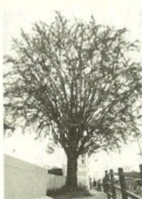
御所馬場町のイチヨウ

とき：6月5日(金)～6月25日(水)午前9時～午後5時(月曜日休館) ▼ところ：ならまち格子の家(元興寺町 ☎三三四八二〇) ▼入場料：無料 ▼問い合わせ：ならまち振興財団(☎二七一一八二〇)へ。