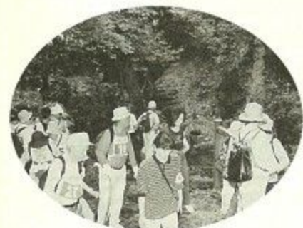
石畳を踏みしめ石仏を訪ねる柳生街道。