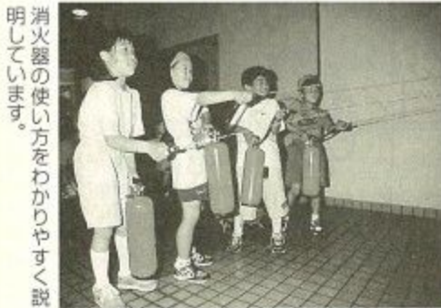
消火器の使い方をわかりやすく説明しています。