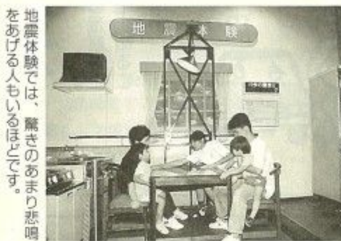
地震体験では、驚きのあまり悲鳴をあげる人もいます。

防災センターは、平成七年八月に開館した施設で、通信指令室や災害対策作戦室を備えるなど、災害対策の中心となります。また、平常時には防災教育や応急手当普及講習会などの防災基地として親しまれ、市民のみなさんに防災に関する正しい知識と、確かな技術を体験しながら学習してもらえます。家族で、友達同士で、ぜひ体験してください。