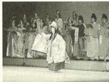
能、狂言、雅楽、オーケストラで表現された幻想的な演出に約1,000人が魅了されました。

奈良に伝わる「春の女神伝説」「業平伝説」「采女伝説」の三つの伝説を中心に奈良の四季折々の歳時を織りまぜた歴史絵巻を、四月十二日、県文化会館で開きました。