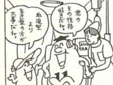
奈良市人権問題啓発活動推進本部