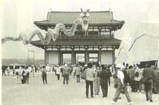
10日間で約40万人の人出があった平城京98会場

●平城京98 朱雀門・東院庭園の復原と市制施行100周年を記念して、四月十七日から二十六日までの十日間、平城宮跡を中心にいろいろな記念イベントが繰り広げられました。 朱雀門開門を合図に平城京98が開幕。古代の衣装を身にまとった天平行列、中国で古くから人々に吉祥をもたらす慶事として伝わる華夏飛龍舞の舞、熱気球体験フライト、スタンプラリー