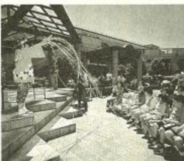
行き交う人たちが足を止め、愉快で、すばらしい演技や演出に見入っていました。

ゴールデンウィーク中の五月四日・五日、高の原中心広場や大湖池公園東地区などで日本の大道芸、西洋のパフォーマンス、市民の文化サークルが「なにか楽しもうなまち・奈良」を演出しました。