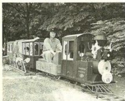
ミニSLまほろば鉄道の運行。

五月五日「子どもの日」、大湖池公園東地区で開かれ、約三千人が参加、多くの家族連れで賑わいました。会場内では、なつかしのおもちゃの展示と遊び、消防はしご車体験などがありました。