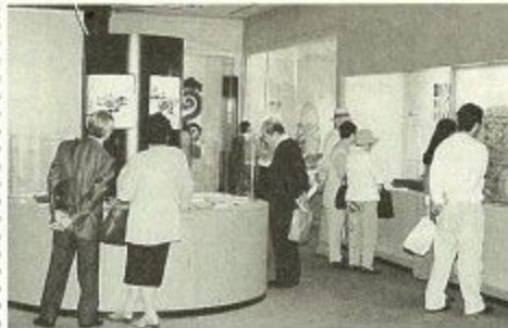
期間中約2万人が訪れました。

五月五日、柳生街道（滝坂の道）から円成寺方面へ約三百人が歴史と自然に触れながらハイキングを楽しみました。