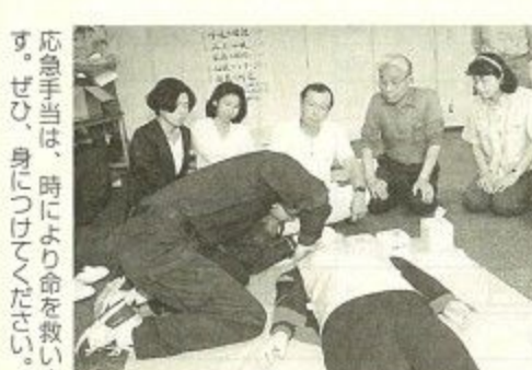
応急手当は、時により命を救います。ぜひ、身につけてください。

【問い合わせ必要】 。雨具を身につけ超ハードな体験をしてみませんか。 【地震体験】 震度1〜7の地震や関東大震災をはじめとする過去に起こった大地震の揺れを再現します。阪神・淡路大震災がどんなに恐ろしい地震だったか、震度7をぜひ体験してください。 【救急措置訓練室】 人工呼吸や心臓マッサージなど救命に必要な応急手当を身につけることができます。 月2回定期的に応急手当普及講習会を行っています。(申し込み日より案内) 【視聴覚室】 最新の映像システムにより防災学習ができます。