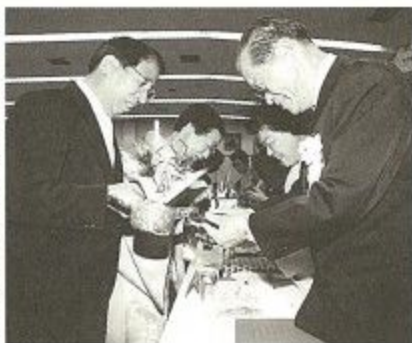
大川市長夫妻が参加者一人ひとりに語りかけながら木杯に祝酒を注ぎました

結婚五十年を迎えるご夫婦を祝う金婚祝賀会が、十一月三日「文化の日」に市役所で開かれました。