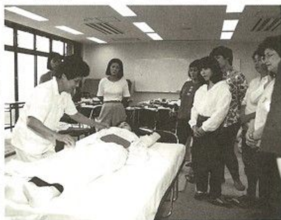
真剣な表情で講師の説明を聞く受講生のみなさん

私が取材したのは二級課程で、ちょうど「衣類着脱の介護」という項目を四、五人ずつのグループに分かれて実技実習されているところでした。グループ