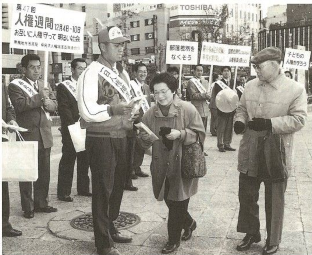
差別のない明るい社会の実現を願って、人権週間中は各地でさまざまな行事が繰り広げられます。