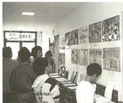
力作ぞろいのふれあいポスターに見入る参加者

このほか会場では、点訳・要約筆記などの体験コーナーやふれあいポスターの展示、楽しい音楽の広場やミニバザーなどが行われました。