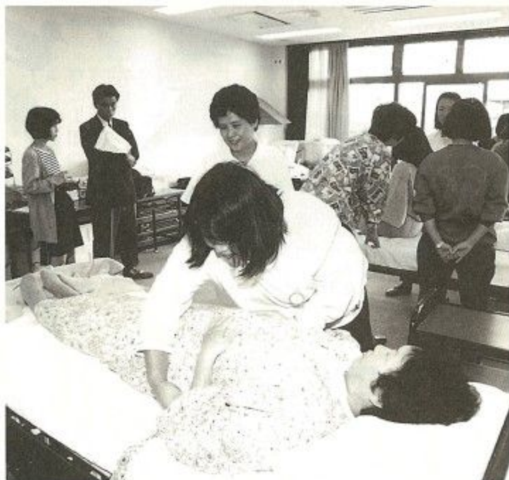
今日の実習課題は「衣類着脱の介護」。受講生が交代でモデルになり実習は進みます

少し前に「しみんだより」を見ていて、「ホームヘルパー養成講座」の募集記事が目にとまりました。ホームヘルパーという言葉は最近よく耳にするけれど、ホームヘルパーになるにはどんな研修を受け、どのような技術を身に付ける必要があるのだろうかかと興味を持ちました。