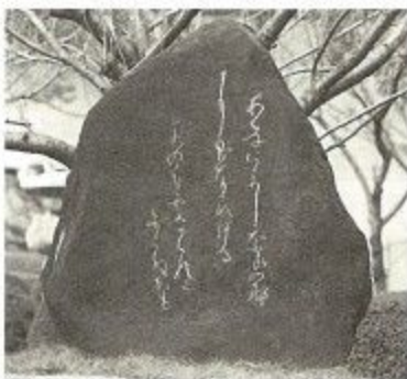
市役所前庭にあるこの秀歌を刻んだ万葉歌碑

歌五首のなかの一首です。歌の大意は、「奈良の都にたなびいている空の白い雲は、いくら見ても見飽きないことだ」ということです。 一読して、色彩豊かで鮮かな印象を受けます。新羅への旅の途上、家人との別れを嘆き、強い懐郷の念を込めて、白雲たなびく青や朱色に彩られた美しい奈良の都をたたえ、歌いあげています。