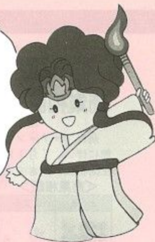
ならまつり マスコットキャラクター 煌(きらら)ちゃん

今年も8月16日～18日の3日間、「ならまつり'91」が開かれます。今回は、県新公会堂(前夜祭)と史跡平城宮跡朱雀大路跡を舞台にちょいちょいおどりやジャズコンサートなどイベントが盛りだくさん。もちろん模擬店もたくさん出店して楽しい遊びもいっぱいです。