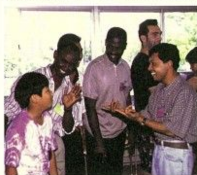
世界の人々が、笑顔で人権を尊重する社会をめざして

そして一九九七年には、二〇〇〇年を「平和の文化国際年」と決めました。これは、二十世紀が歴史的に見て「戦争の世紀」であり、暴力、偏見、差別といった「戦争と暴力の文化」が支配的であったことを反省し、「平和と非暴力の文化」を広めていこうとの考えから定められたもので、来るべき二十一世紀を「人権の世紀」とするための取り組みを進めるにあたり、その節目の年にしようとしたのです。