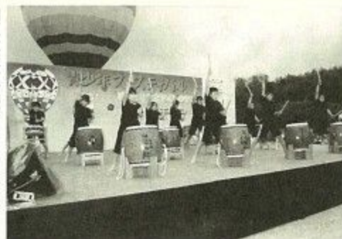
田原太鼓を披露することもち

十月二十九日、鴻ノ池運動公園補助競技場（法蓮町）で、「はばたけ！二十一世紀へ夢のせて」をテーマに青少年フェスティバルが開かれました。青少年フェスティバルは、青少年の積極的な社会参加を促進し、青少年団体の活性化と連帯意識を高めようと開かれたもので、青少年や青少年団体を中心とって行ういろいろなイベントに二千五百人が参加しました。