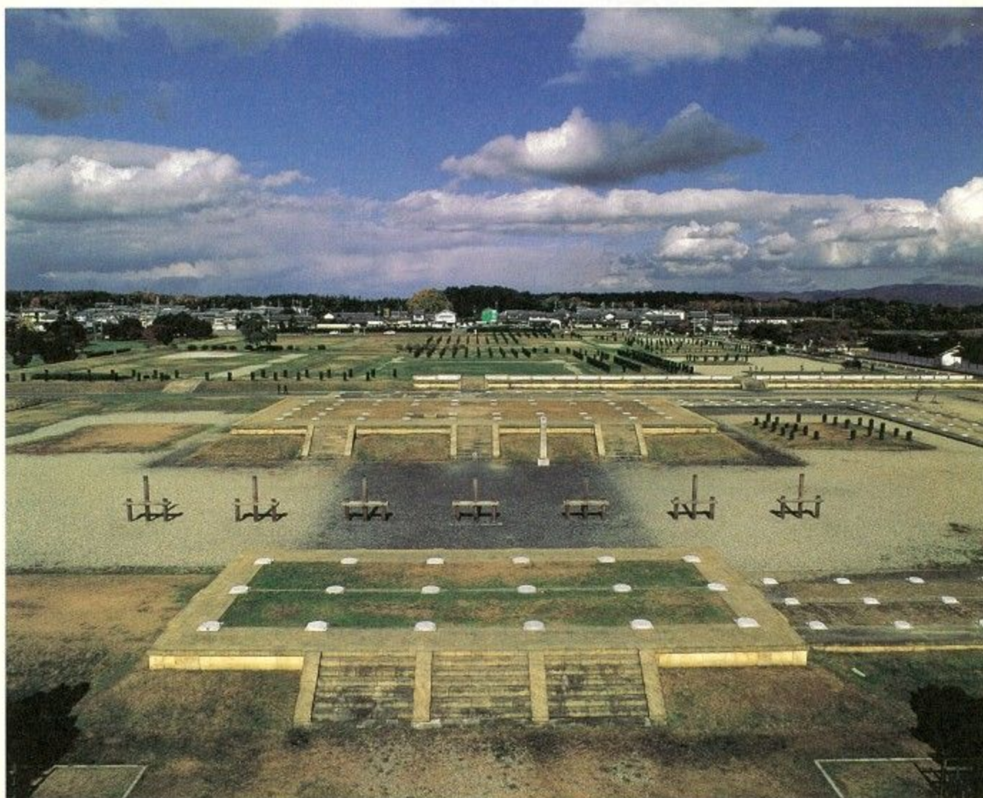
世界遺産 平城宮跡 (大極殿跡)