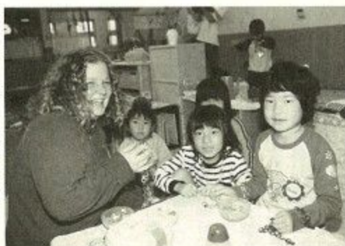
園児たちと楽しく遊ぶメンバー

まず、地域交流活動として学園南保育園でのメンバーの活動を見せていただきました。園内に入ると、五歳児の子ど