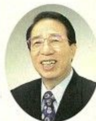
奈良市長 大川靖則