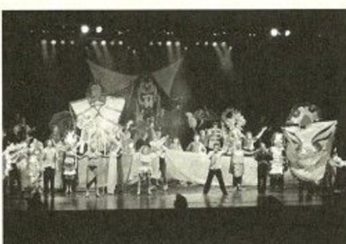
ミュージカル「コモンビート」のクライマックス

アップ・ウイズ・ビーブルが、これからも世界各地で広がり多くの若い人たちが参加し、国際人として成長していったらいいと心から思いました。