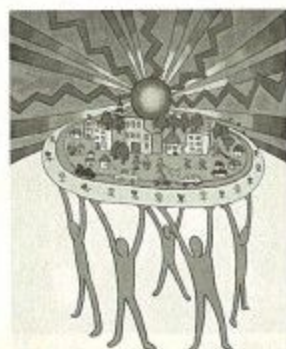
差別のない明るい世界