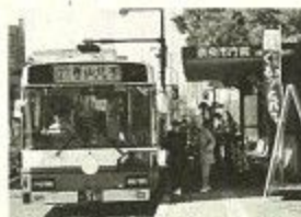
公共交通機関の利用を

ほんのわずかなことでも大勢の人が実践すれば、わたしたちの地球を救う大きな力になります。まだ実践していない人も、まずは一歩ふみ出してみませんか。くわしくは、市役所環境交通課へ。