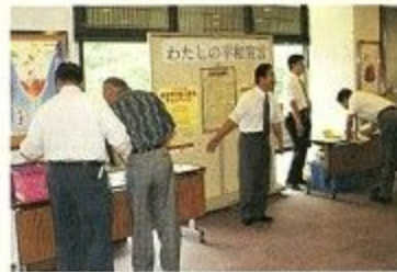
署名する市民のみなさん

すべての人に「平和の文化国際年」の理解と国際的な取り組みの参加を呼びかけるため、ユネスコでは「わたしの平和宣言」の署名活動を行いました。