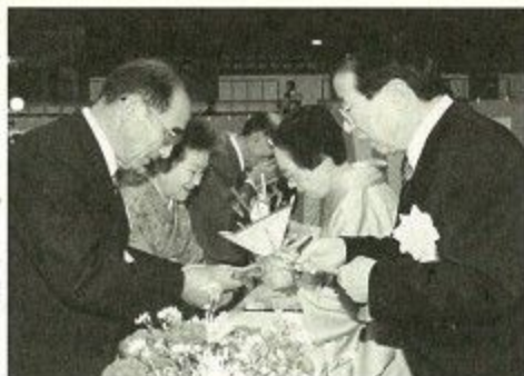
一人ひとりにお祝いの言葉をかけながら祝酒を注ぐ大川市長夫妻

結婚五十年を迎えるご夫妻を祝う結婚祝賀会が十一月三日、中央体育館で開かれました。今年、昭和二十五年に家庭を持った百九十五組が参加しました。