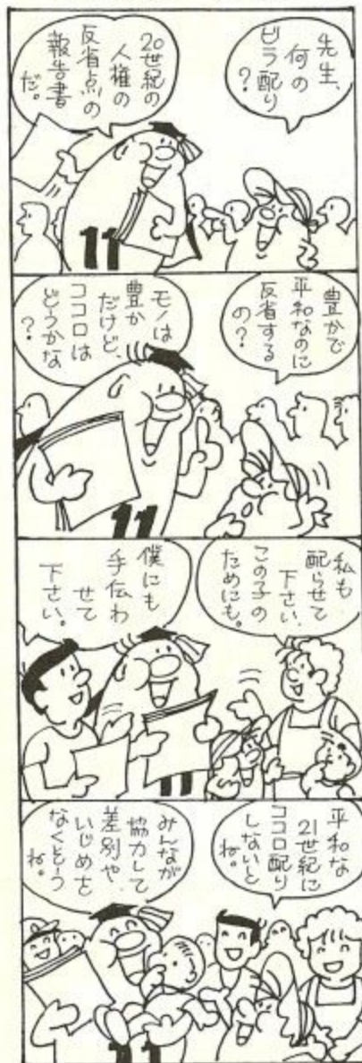
奈良市人権問題啓発活動及び人権教育推進本部