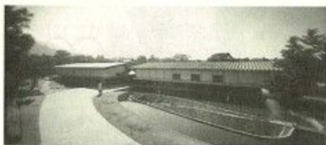
奈良国立博物館新館