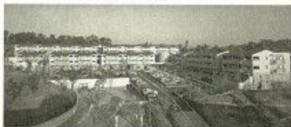
グランドメゾン学園前 ガーデンテラス