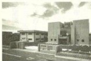
埋蔵文化財調査センター

に関する講演 ▼入場料：無料 ▼申し込み：往復はがきに、住所、氏名(ふりがな)、年齢、電話番号を書いて、5月26日必着で、同センターへ。1枚に一人限り。多い場合は抽選。