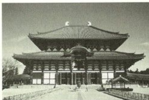
世界遺産に登録された東大寺

【宿泊など】 現地集合・現地解散が原則のため、各自でお願いします。なお、東大寺の宿泊施設「華嚴寮」(定員26人・男女別相部屋、1泊朝食付4,000円)、県立「国際奈良学セミナーハウス」(定員17人・男女別相部屋、1部屋2～3人、1泊朝食付4,000円～5,100円)が特別に使用できる予定です。宿泊希望者は、申し込み時に明記してください。多い場合は抽選(18歳未満は保護者同伴)。