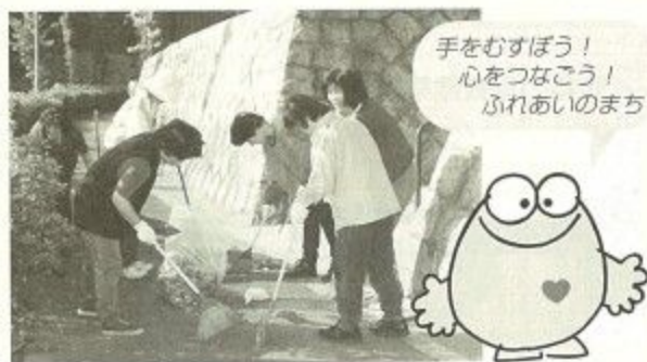
市民ふれあい運動マスコットキャラクター「ふれあいくん」

市民相互のふれあいを通じて、やさしさとふれあいのある明るく住みよい心豊かなまちづくりを進めましょう。今月21日は、市内一円で運動推進の重点目標である環境美化を中心に清掃などの実践活動が行われます。