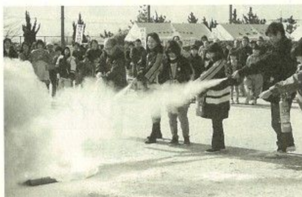
防災訓練を行う神功地区のみなさん