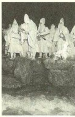
鶴の瀬のお水送り行事

東大寺二月堂「お水取り」に先立ち、福井県小浜市神宮寺で行われる「お水送り」のクライマックスに、遠敷川の