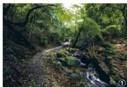
①柳生街道「滝坂の道」。江戸時代に整備された石畳の道が残ります

②円成寺本堂。名勝指定の美しい庭園や、仏師・運慶の最初期作である国宝・大日如来坐像を安置 ③夜支布山口神社。大柳生町の氏神。摂社の立磐神社 (国指定重要文化財) には、ご神体である磐座が鎮座