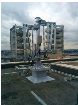
ホーンアレイスピーカー