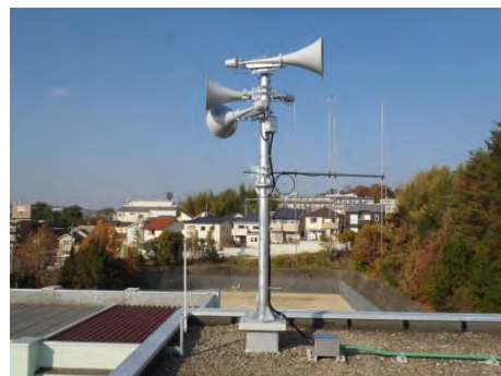
トランペット型スピーカー