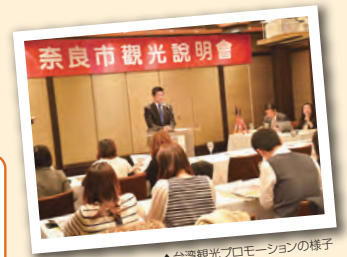
▲台湾観光プロモーションの様子