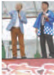
→7日の特別ゲストには、山本浩之アナウンサーが登場!