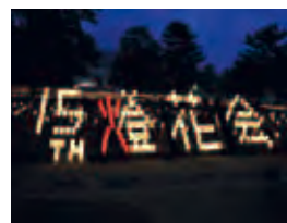
右上：15周年記念にデザインし並べられた燈花会カップ 左上：春日野園地のやさしい灯り 左下：上から見ると…しかまるくん!