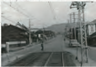
昭和20年代後半