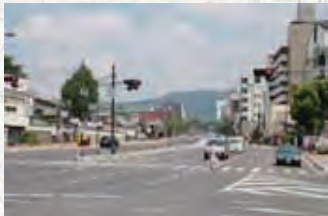
現在の油阪 (平成25年8月撮影)

上の写真は昭和20年代後半に撮影された油阪の写真です。かつて近鉄奈良駅と現在の新大宮駅の間には「油阪駅」があり、写真からも分かるように、油阪駅から奈良駅までの約1kmの区間は車道との併用軌道でした。 昭和44年に交通量の増加に伴い近鉄奈良駅とともに地下化され、奈良地下線が開通。これに伴って「油阪駅」は廃止され、西側約1kmに「新大宮駅」が開業しました。 線路はなくなりりましたが、春日山の変わらぬ美しい峰は今でも油阪の道から望めます。