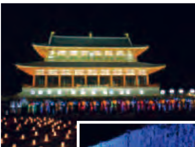
ライトアップされた大極殿前とろうそく天平行列

期間中、約2万9千人が訪れました。浴衣姿の女性や親子連れも多く見られ「思っていた以上に光の行列がきれいでした。グルメブースも多く、楽しめました。」という声もありました。