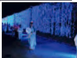
青色のイルミネーションが薄のよう に美しい碧の小道