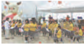
→夜は大盆踊りで賑わいます。

「小雨がパラパラ…。楽器を雨からタオルで守りながら聞き覚えのあるリズムが響く音楽でオープニングを盛り上げます。」