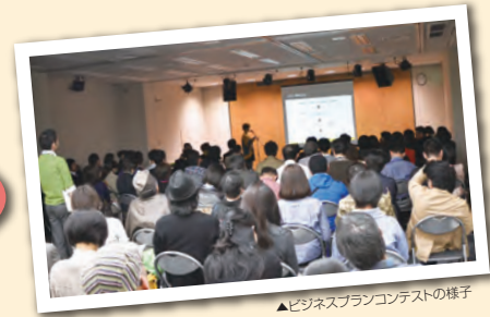
▲ビジネスプランコンテストの様子