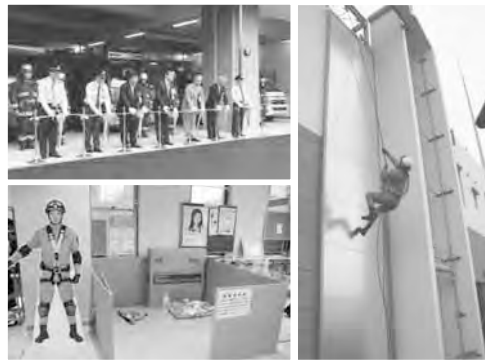
右：庁舎壁面を利用した訓練設備 左上：晴れやかにテープカット 左下：防災情報を発信する市民防災コーナー

防災の日の9月1日、移転建替え工事を進めていた西消防署（鶴舞西町）が完成し、竣工式を行いました。鉄筋コンクリート2階建ての新庁舎は、太陽光発電設備や非常用発電設備等を備え、災害時の消防防災活動の拠点となる機能があります。また、女性職員の職域拡大に対応するための女性専用の仮眠室の他、庁舎1階には防災情報の発信の場となる市民防災コーナーを設置しています。 今後は新たな設備を活用し、よりいっそう地域住民のみなさんと協働して、地震や災害に強いまちづくりをめざします。