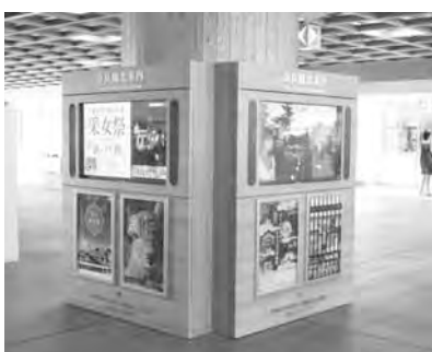
人通りの多いJR奈良駅改札前の東西自由通路で、タイムリーなイベント・観光情報を動画と静止画で発信中！

お近くにお越しの際には、ぜひご覧ください。 【デジタルサイネージの放映時間】 午前7時～午後11時