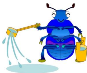
奈良市の環境キャラクター ルリくん