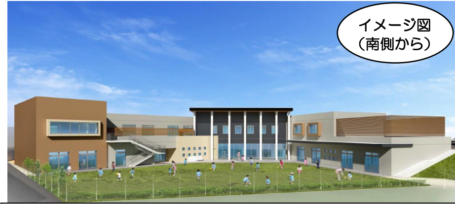
イメージ図 (南側から)

※本イメージでは、園庭の全面に芝生を採用しておりますが、現時点の施設整備内容については、園庭に築山や砂場等を設置のうえ、大部分を土とすることを想定しています。