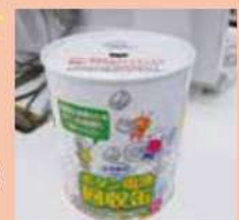
ボタン電池回収缶