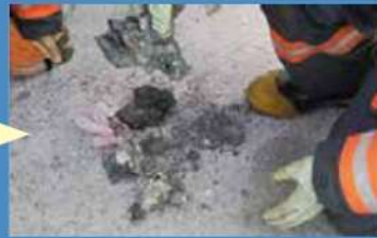
ごみ収集中に発火した小型二次電池