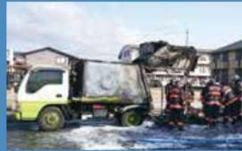
全焼した奈良市のパッカー車