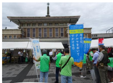
カーフリーデーベストショット賞受賞写真

地球温暖化や大気汚染、渋滞などの都心における車中心の生活から引き起こされる諸問題の解決を目指し、地域における車に頼らない快適なまちづくりを考える社会啓発運動として、「モビリティウィーク&カーフリーデーなら」を実施しました。カーフリーデーとされる9月22日に、JR奈良駅東口駅前広場（三条本町）でのブース出展のほか、ウォーキングイベントやサイクリングイベントの実施、三条通りの一部で交通規制を行い、車を使わない空間を創り出しました。イベントを通して、「奈良は車で来ない方が楽しい」「車に乗らない方が暮らしやすい」を体感してもらうことで、車に頼らないまちづくりを考える機会となりました。本市の取組は、モビリティウィーク&カーフリーデー日本アワード2018で「まちづくり貢献賞」と「カーフリーデーベストショット賞」を受賞しました。