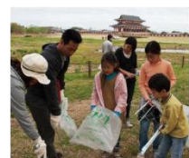
平城宮跡の清掃活動

平城宮跡の保護活動は、清掃活動やボランティアガイドなどの取組として受け継がれ、宮跡をより一層魅力的なものとしている。