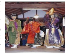
奈良豆比古(ならずひこ)神社の翁舞(おきなまい)

地域の社寺、集落が織りなす美しい景観を舞台とした祭礼・行事は、各地域固有の豊かな歴史や文化を象徴している。