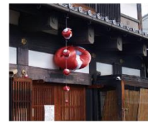
奈良町軒先の身代わり申(みがわりざら)

人々の日々の生活に浸透した民間信仰は、軒先の身代わり申等として、信仰を感じられる情緒豊かな景観を創り出している。