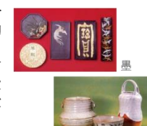
赤膚焼(あかはだやき)

平城京や正倉院を淵源とした伝統的な工芸や産業は、天平の遺風を受け継ぐ優雅な気品をとどめ、伝統の技と心を感じられる。