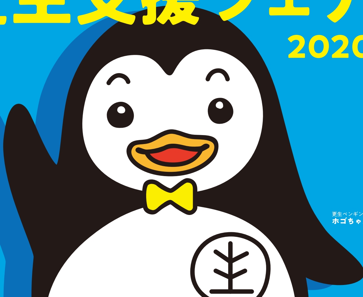
更生ペンギンの ホゴちゃん