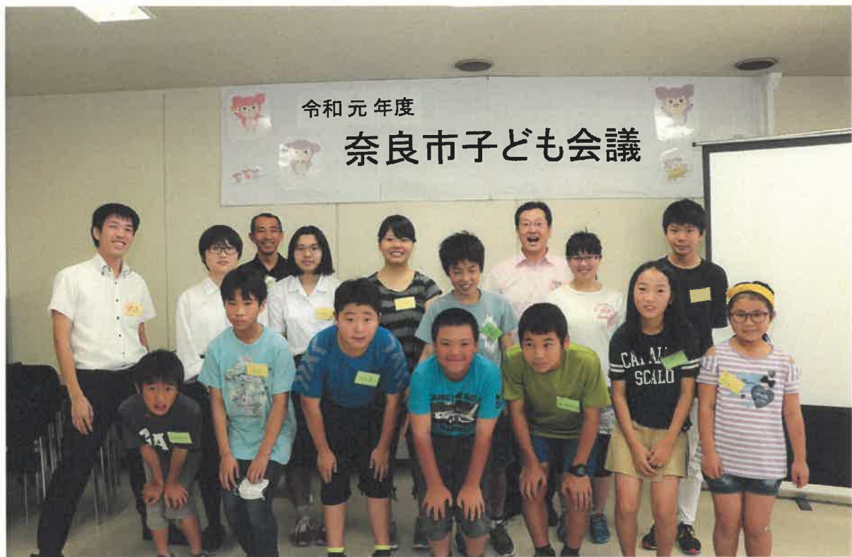
令和元年度「奈良市子ども会議」集合写真