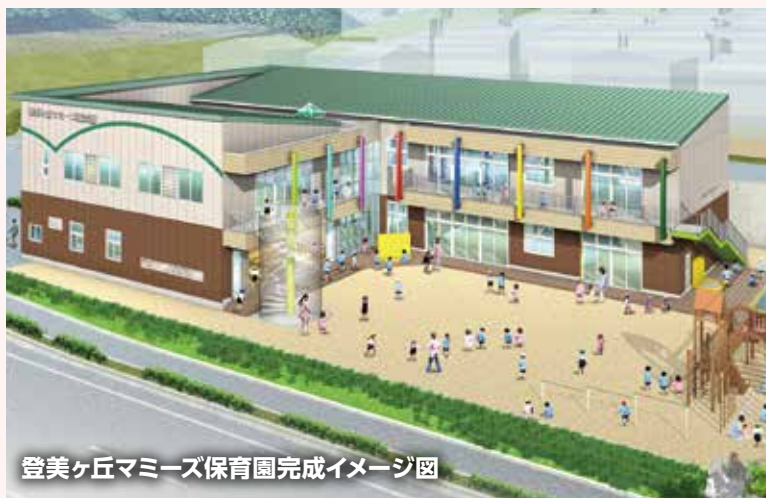
登美ヶ丘マミーズ保育園完成イメージ図

待機児童ゼロをめざし、 保育施設の増設と保育士確保等 を進めています。今年11月にソフィア富雄保育園、12月には登美ヶ丘マミーズ保育園が開園します。さらに、 小規模保育施設の整備 に取り組んでいきます。